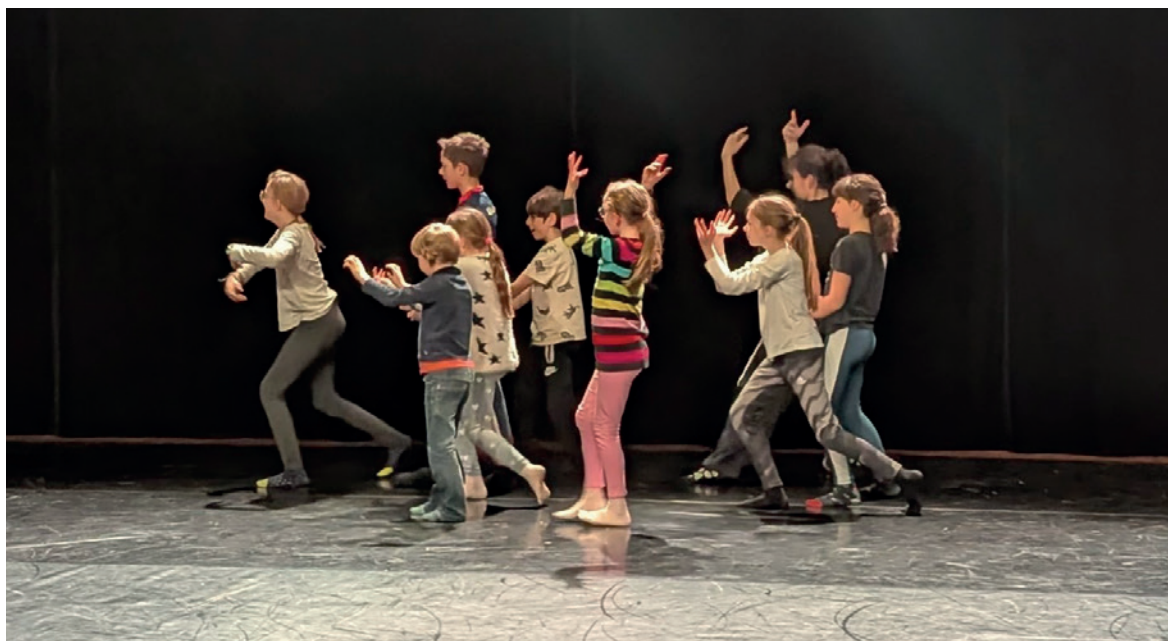
Atelier mené par l'association Libre cours, en parallèle du spectacle Losing it le 31 janvier

Les « Ateliers du Pestacle » de la Scène nationale d'Aubusson accueillent les enfants dont l'âge ne permet pas d'aller voir certains spectacles. Ils sont gratuits et sur réservation, pour les enfants dès 4 ans. Ils ont lieu au sein du Centre Culturel et Artistique Jean Lurçat. Animés par des artistes, des animateur·ices ou les médiathécaires de la communauté de commune Creuse Grand Sud, ils proposent des lectures, des jeux et des ateliers, en rapport avec le spectacle vu par les parents.