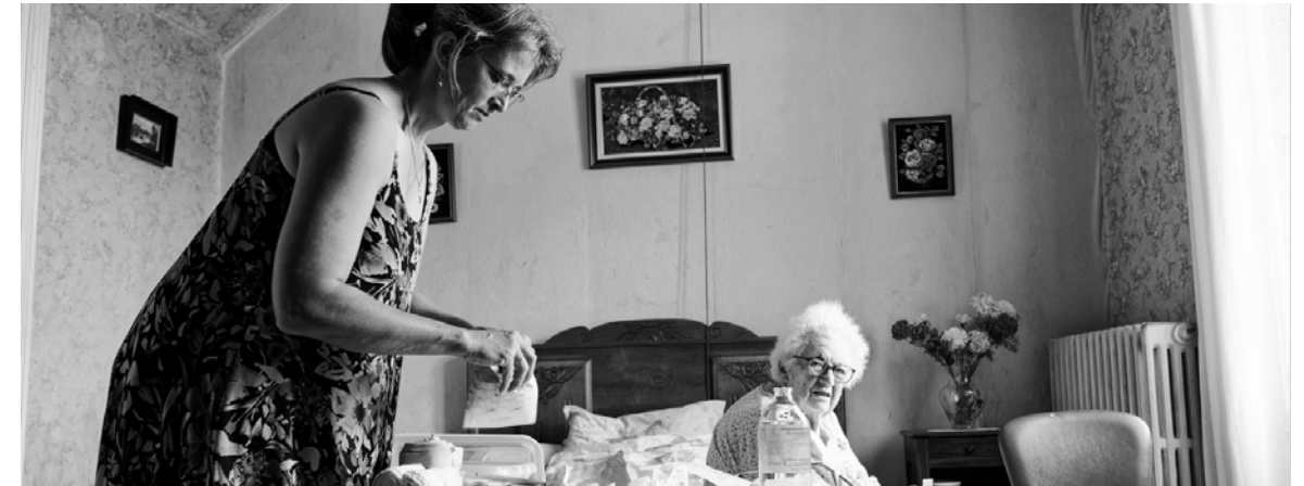
issue de l'exposition Beau Travail, visible du 5 mars au 9 avril.