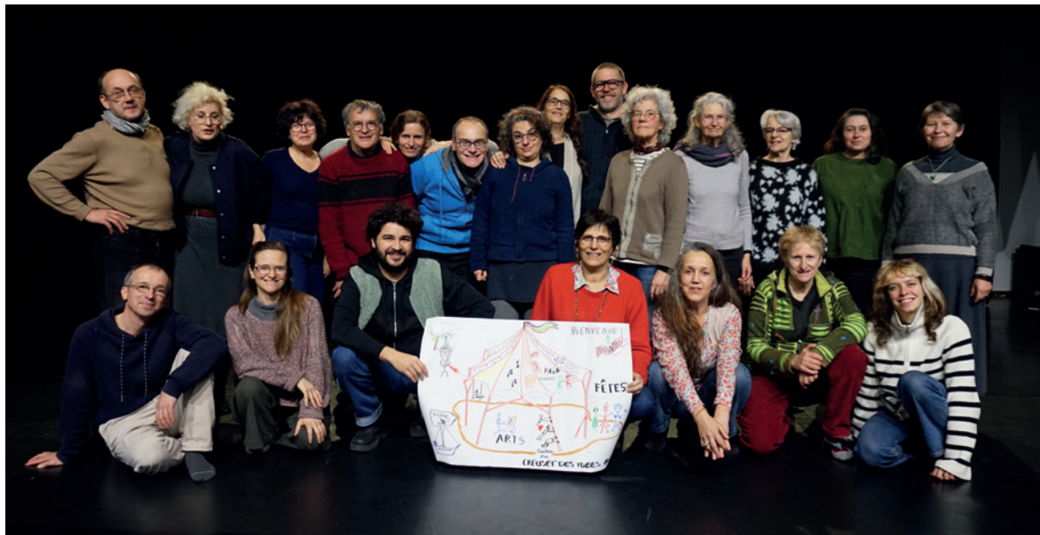
Les participant·es au Creuset des idées #4

Que ce soit via des stages ou masterclass, à la fin des représentations à l'Avant-scène ou lors de bords de scène, le public creusois a nombreuses occasions d'échanger avec les artistes, de partager des moments ou leurs impressions sur ce qu'ils ont vécu. Retour sur les événements de cet hiver, riches en émotions pour les petits comme pour les grands !