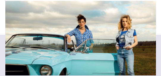
Photo de classe • Balade musicale et imaginative Résidences du 28 au 30 mars et du 10 au 13 juin CRÉATION LE 14 JUIN À L'ÉCOLE DE CHABASSIÈRE