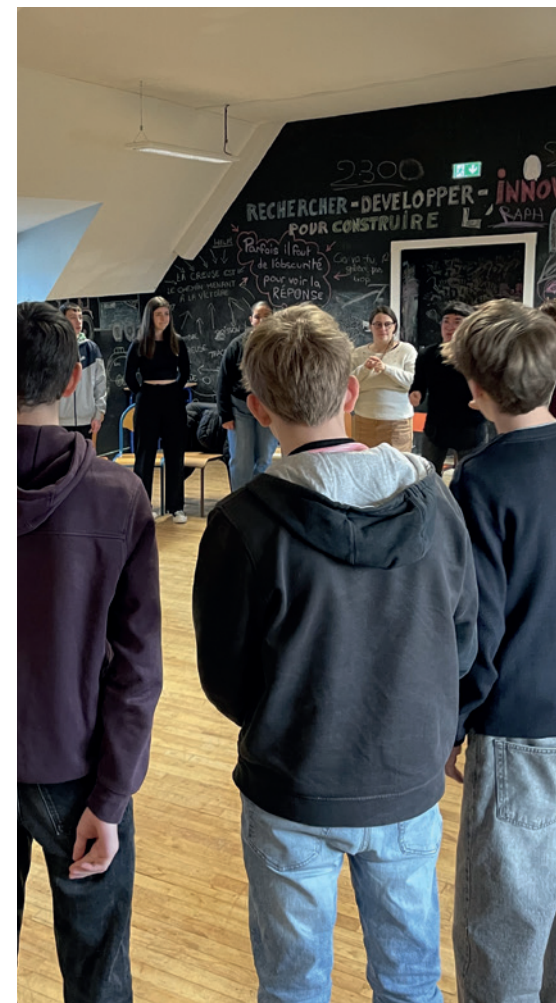
1 er atelier au lycée agricole d'Ahun, le 12 février 2025