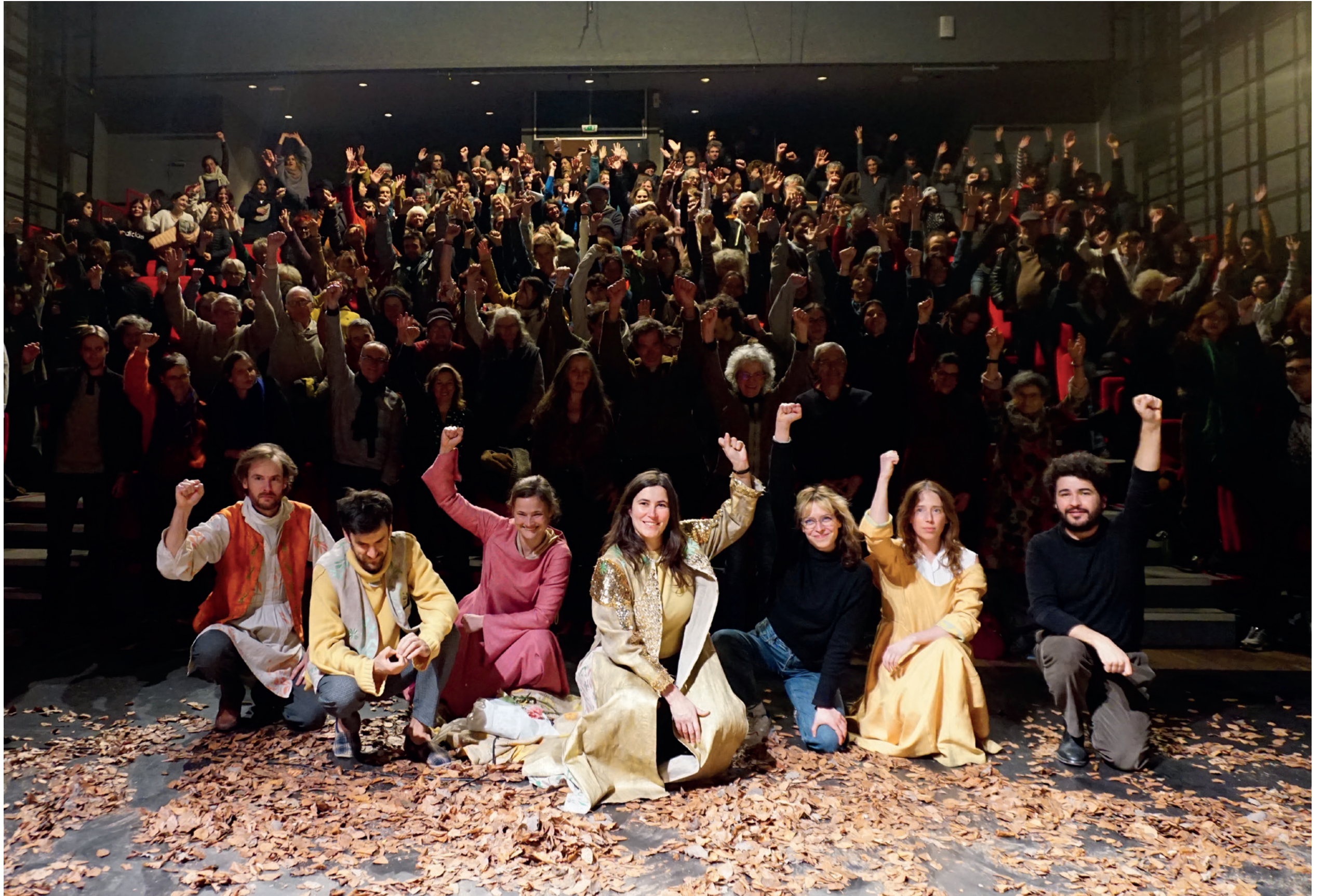
À l'invitation des artistes de la Compagnie Courir à la Catastrophe, la salle au complet était debout pour le mouvement national #deboutpourlaculture, le lundi 10 février, à la fin de la représentation de La Brande. Il s'agissait de marquer son attachement au service public des art et de la culture.