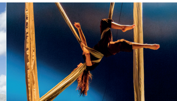
Lignes - Pourvu que rien ne lâche