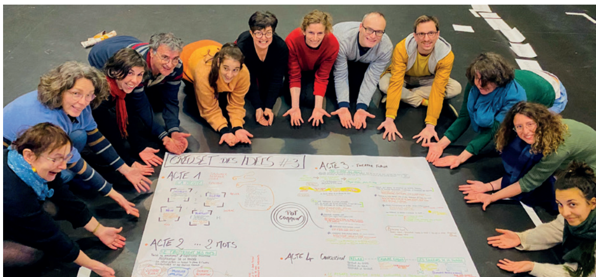
Fin de journée du Creuset #3

Le Creuset des idées est un rendez-vous annuel pour se retrouver après avoir vu un spectacle, afin de partager émotions et questions liées à son thème. C'est une journée qui a pour but d'échanger et de construire collectivement une réflexion autour du sujet abordé, en traversant des expériences sensibles pour faire cheminer nos questionnements.