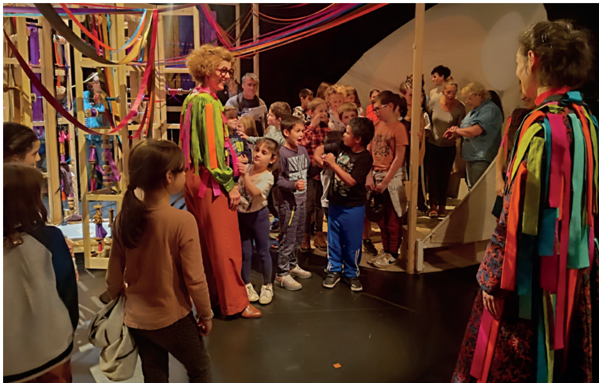
La danse des tarentules - Collectif Maw Maw

Une rencontre avec une autrice, un atelier avec une circographe, un voyage en bus pour applaudir un ballet contemporain, une exposition d'arts visuels et numériques, un spectacle « made in » Creuse ou encore un one-woman-show dans des salles des fêtes : ces trois mois de saison automnale ont été riches en événements pour le public du théâtre Jean Lurçat !