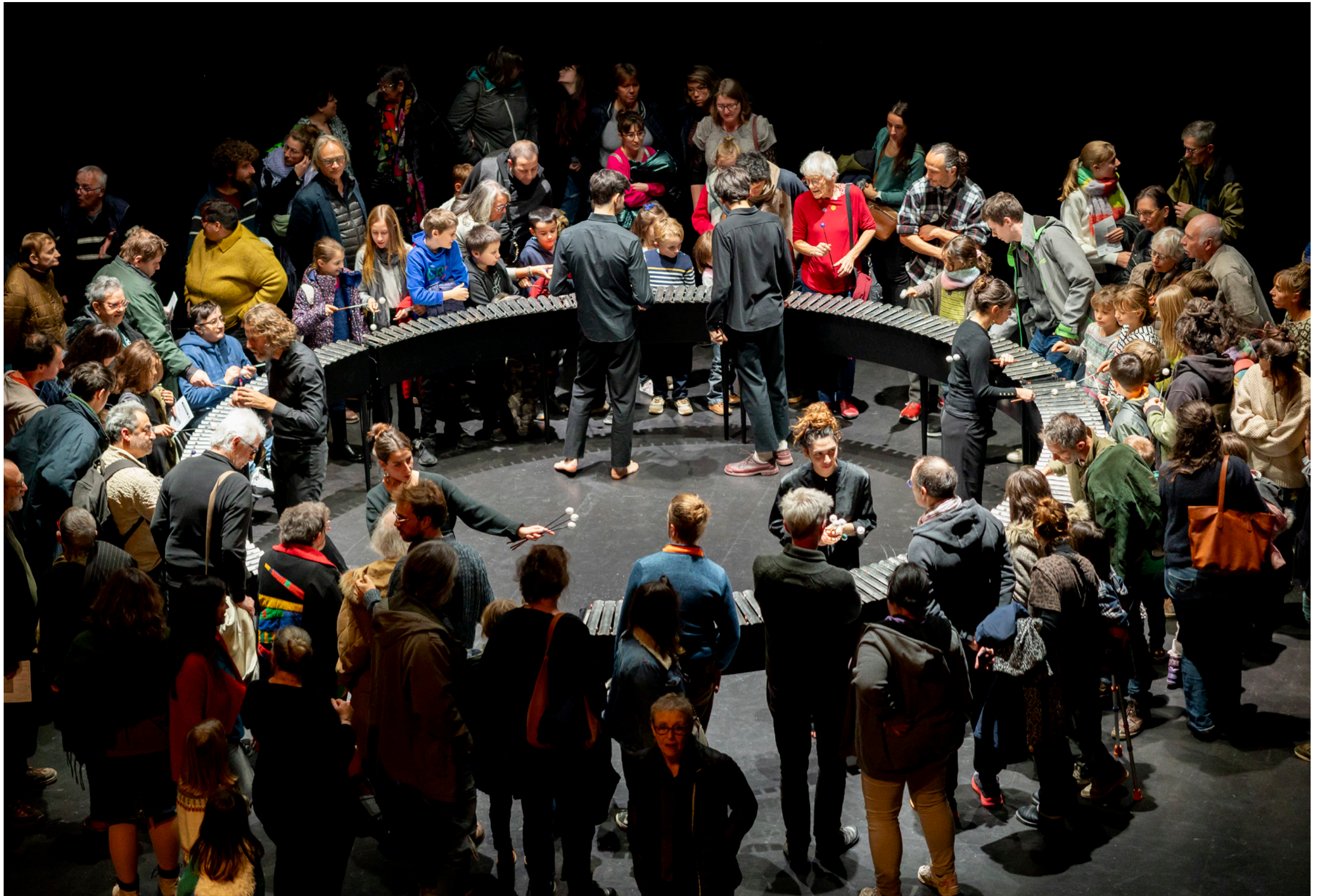
Le public découvre le métallophone, après le concert Les Métamorphoses donné à Aubusson le dimanche 24 novembre