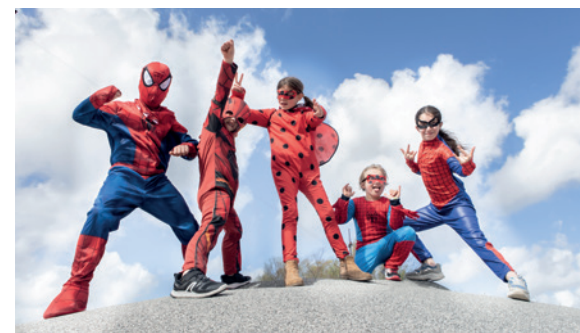
Spiderman, moi et le reste du monde

Cet hiver, trois sorties de résidences sont proposées, dont une à St-Martin-Château.