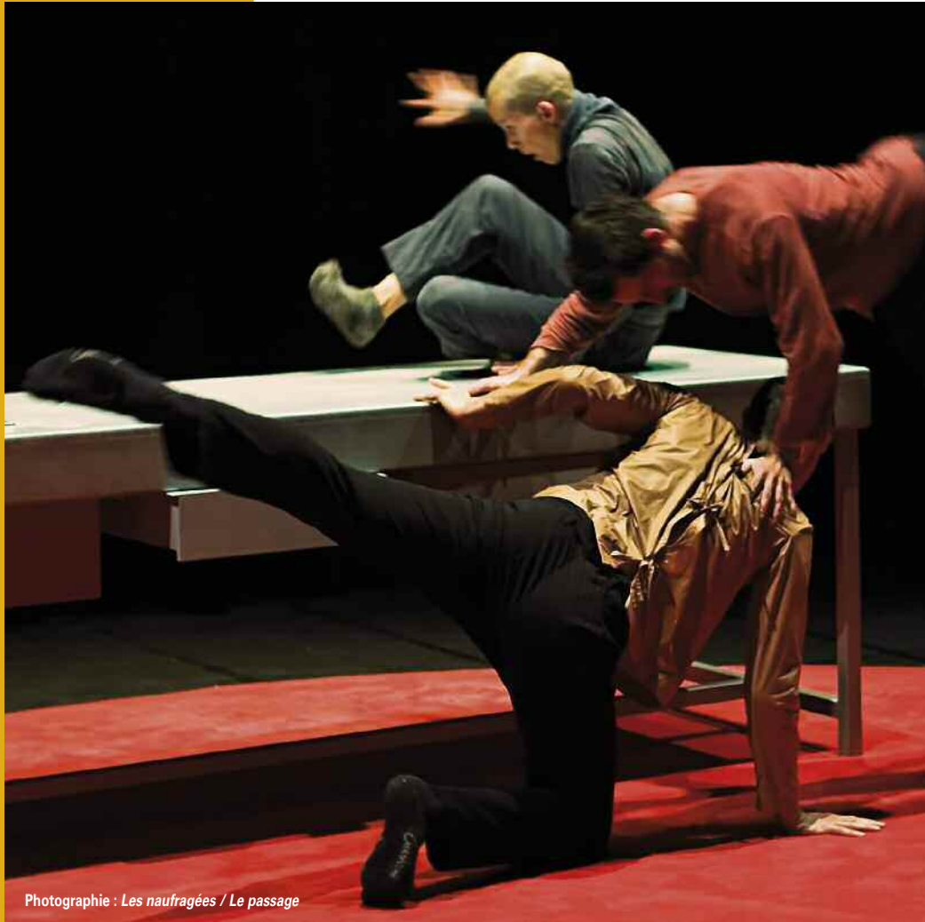
Photographie : Les naufragés / Le passage